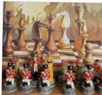
NAPOLEON / DALMENY